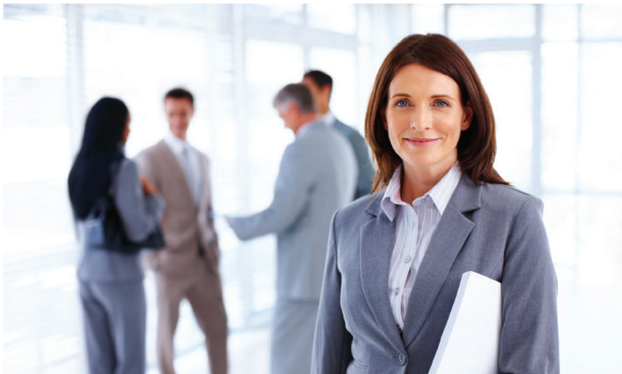
FRAUENJOBS.CH richtet sich an Karriere-Frauen.